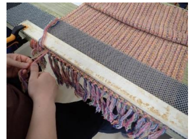
敬老祝い品 房付けの様子

そのさおり織りですが、京都府の敬老の祝い品(100歳になられる方に配られる)手織りのひざ掛け、今年も585枚の受注を受けて、3月終わりから7月の初めにかけてようやく織り終わりました。