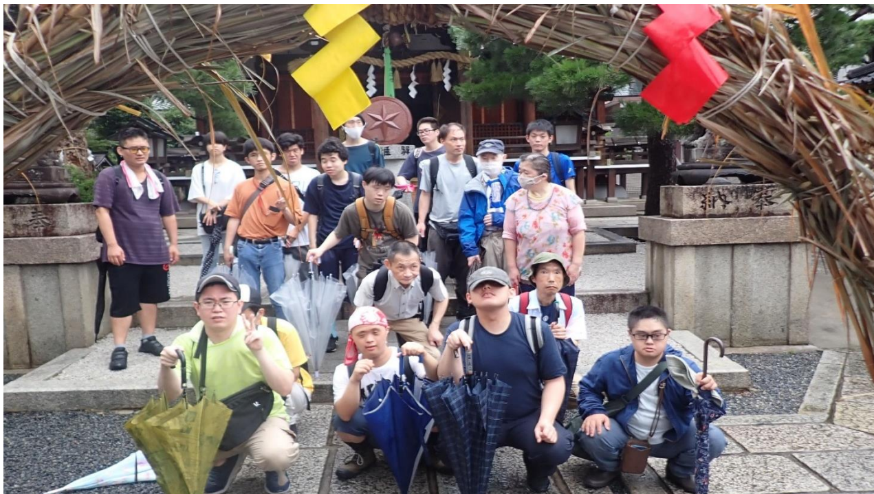
茅の輪くぐり R6.6.30 (大將軍八神社)

社会福祉法人 京都西陣福祉会 障害者多機能型事業所 西陣工房 〒603-8333 京都市北区大將軍東鷹司町 109-1 ☎(075)462-9101 Fax(075)468-9122 mail info@nishijinkoubou.com