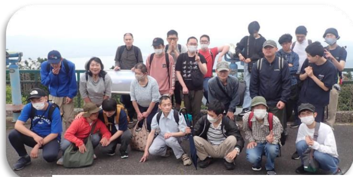
久々の比叡山 R6.4.29 比叡山山頂展望台にて

今日はスポーツデーではないので、ケーブル延暦寺駅までの1kmほど山道を歩きました。スポーツデーでは銀閣寺からの比叡アルプス、修学院からの雲母坂と、定番のコースを1日掛けて必死で登り、いい汗をかいたわけですが、今回はわずか1kmです。ですからスポーツデーの常連さんには物足りなかったけど、歩き慣れてない参加者には足場が悪く、結構大変な山道でした。ゆっくり慎重に歩いて1時間程度でケーブル駅に到着。琵琶湖を見下ろせる休憩所で昼食となりました。近江富士や近江大橋、竹生島がうっすらと見渡せました。そして長さ日本一を誇る坂本ケーブルに乗車。11分かかって坂本に降りました。ケーブルから降りて、日吉大社を始めとする綺麗なたづまの門前町を散策してJR湖西線の比叡山坂本駅まで歩き、JRで山科まで帰り、解散としました。西陣工房まで帰った組は、西大路御池から西陣工房まで歩きましたが、それでも今日の歩数は15000歩でした。