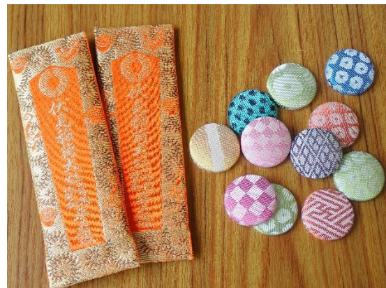
下請けの伏見稲荷のお守り (左) と自主製品マグネット (右)