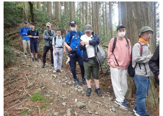
比叡山山頂からケーブル延暦寺駅までの山道 R6.4.29