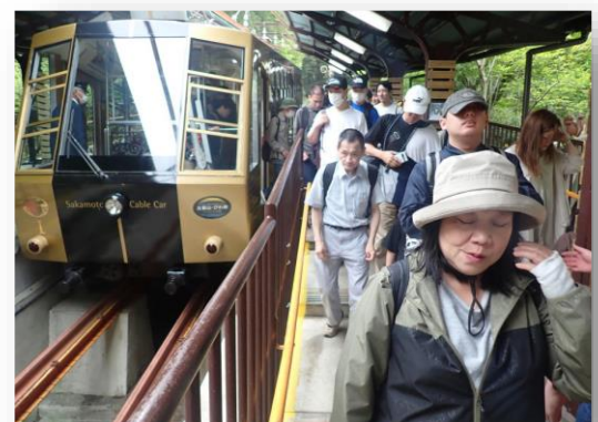
坂本ケーブル R6.4.29 ケーブル坂本駅にて