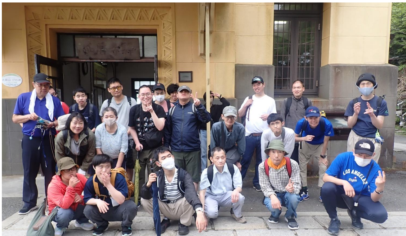
比叡山に行ったよ～！！ ケーブル延暦寺駅にて R6.4.29 (月 昭和の日)

社会福祉法人 京都西陣福祉会 障害者多機能型事業所 西陣工房 〒603-8333 京都市北区大將軍東鷹司町 109-1 ☎(075)462-9101 Fax(075)468-9122 mail info@nishijinkoubou.com